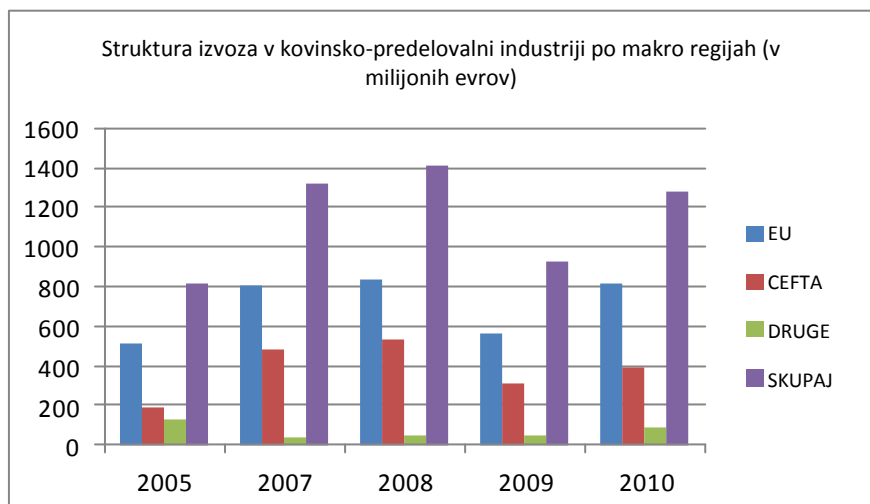
Graf 1: Struktura izvoza v kovinsko-predelovalni industriji po makro regijah (v milijonih evrov)